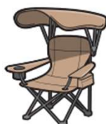
シェード付きチェア