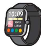
ウェアラブル端末