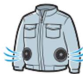
ファン付きウェア