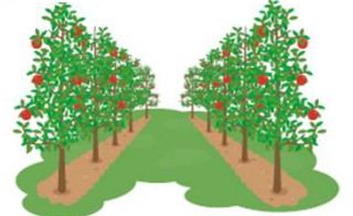
省力樹形への転換